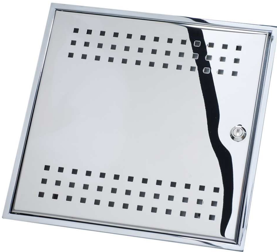
Serienmäßig: Vorreiberverschluss münzbetätigt